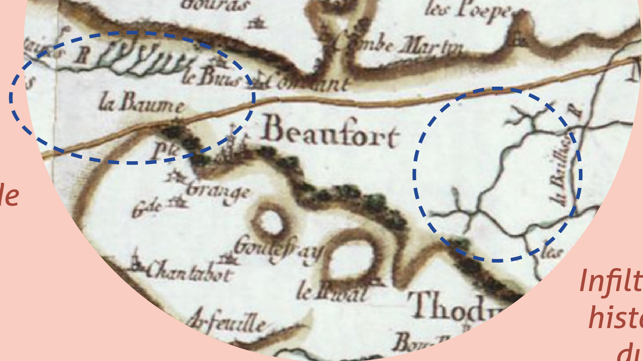
Zone des sources de Beaufort