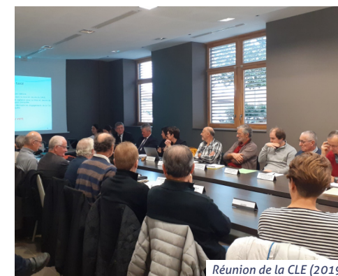
Réunion de la CLE (2019)