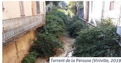
Torrent de la Pérouse (Virville, 2019)

Pour retrouver un fonctionnement plus naturel du bassin versant, caractérisé par une infiltration importante des eaux superficielles, le SAGE propose notamment :