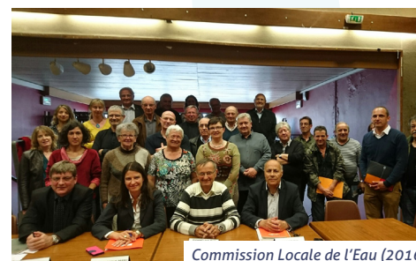
Commission Locale de l'Eau (2016)

Pour garantir l'adéquation de l'aménagement du territoire avec les objectifs du SAGE, le SAGE préconise notamment :