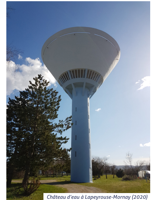
Château d'eau à Lapeyrouse-Mornay (2020)