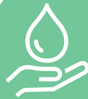
Schéma d'Aménagement et de Gestion des Eaux